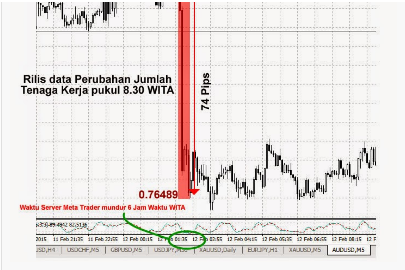
Gambar 2: Contoh grafik pergerakan harga AUD/USD saat rilis data Perubahan Jumlah Tenaga Kerja.

Dari gambar grafik diatas, kita bisa melihat bagaimana suatu berita bisa mempengaruhi grafik harga AUD/USD secara ekstrim.