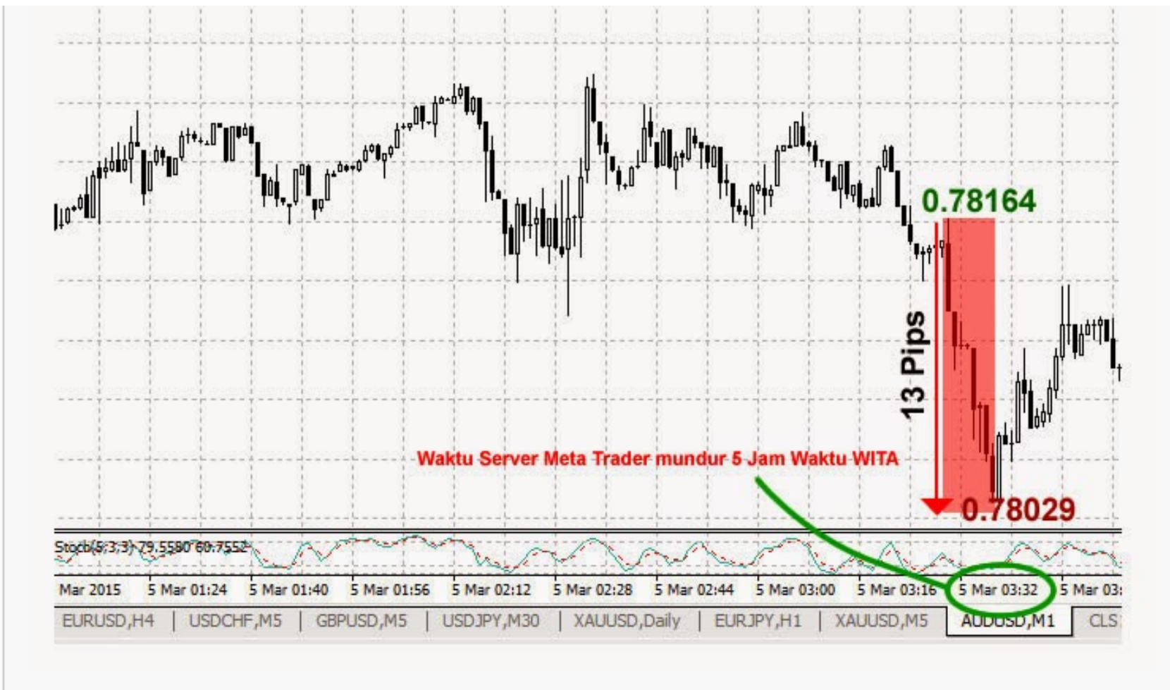
Gambar 1: Contoh grafik pergerakan harga AUD/USD saat rilis data Penjualan Retail dan Trade Balance.